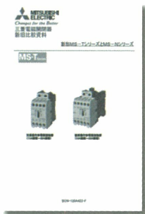
三菱電磁開閉器新旧比較資料 BON-120A423