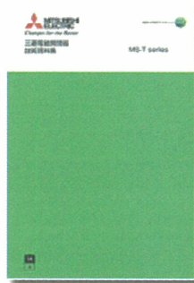
三菱電磁開閉器 MS-T シリーズ 技術資料集 SH (名) 020005-A (1411)