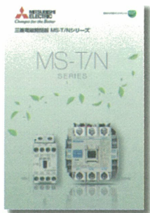
三菱電磁開閉器 MS-T/N シリーズ L (名) 02031-A