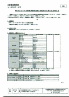
三菱電磁開閉器 セールスとサービス 076/081